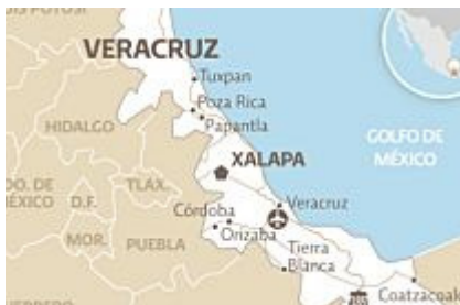
Hallan campo de entrenamiento de "Los Zetas" en Veracruz