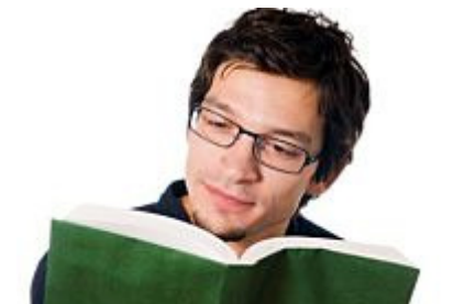
Comprar libros es invertir, no gastar