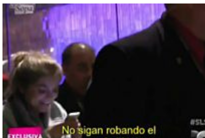
Increpan a hijastra de Peña en Las Vegas por Casa blanca