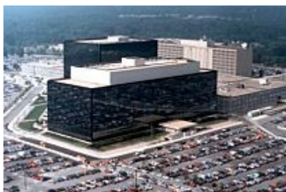
México, víctima de ciberespionaje de la NSA