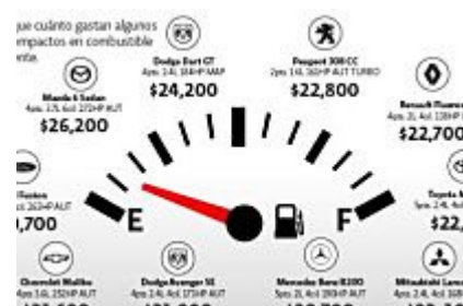
Ahorre al cargar gasolina