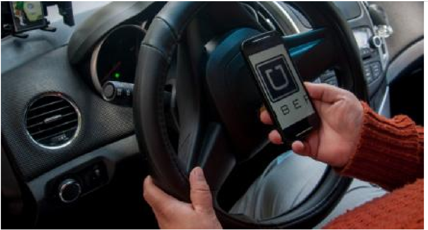
Decepciona a socios negocio de Uber