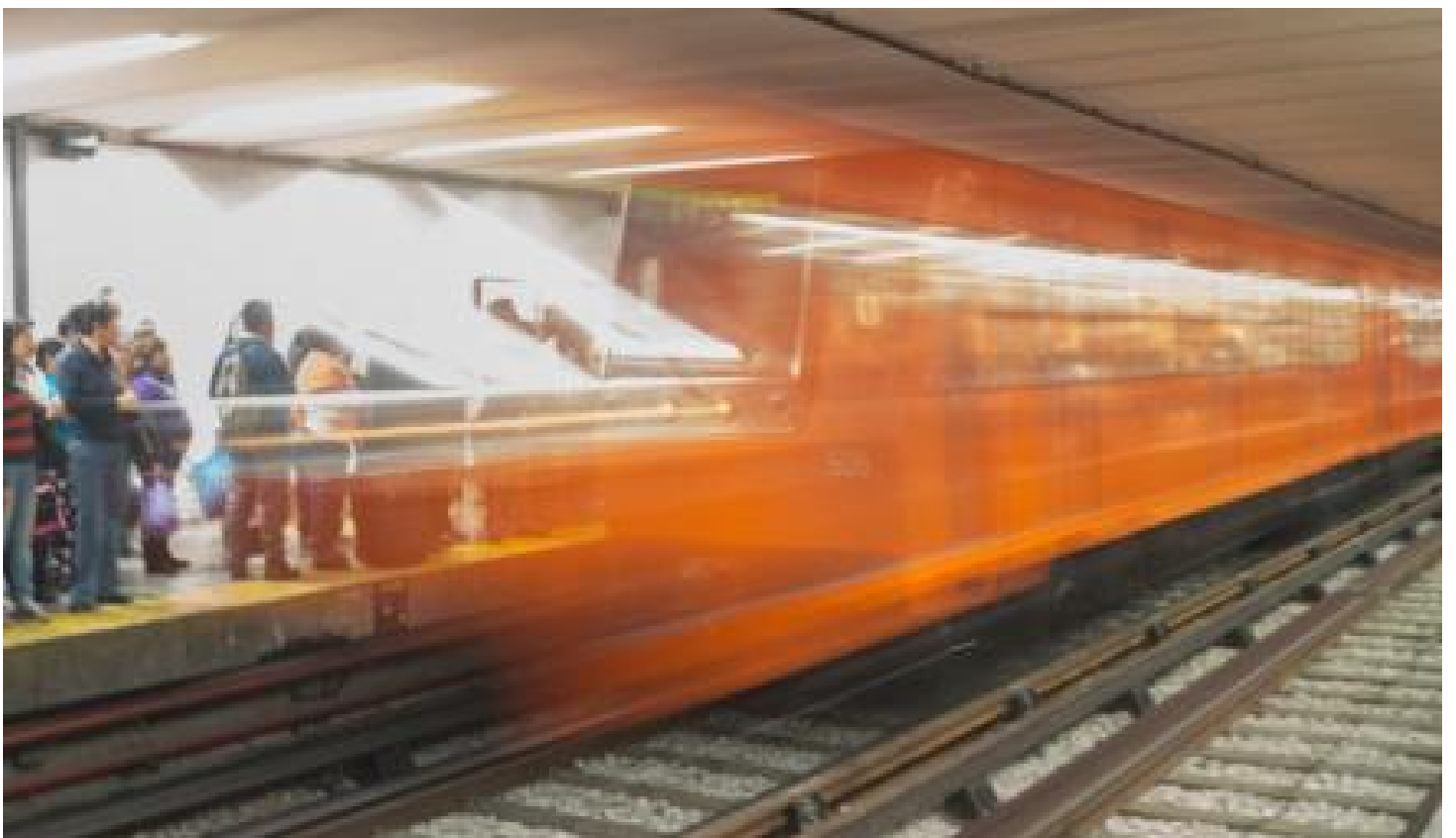
El vagón más tétrico del Metro