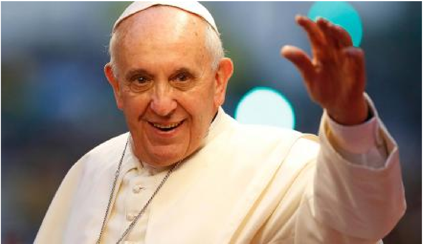
Cierran escuelas, estaciones de Metro, Metrobús y Ecobici por visita del Papa