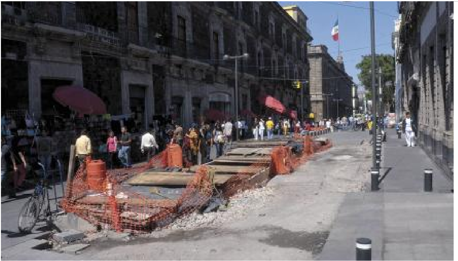
Crece hallazgo (y rescate) de pirámide