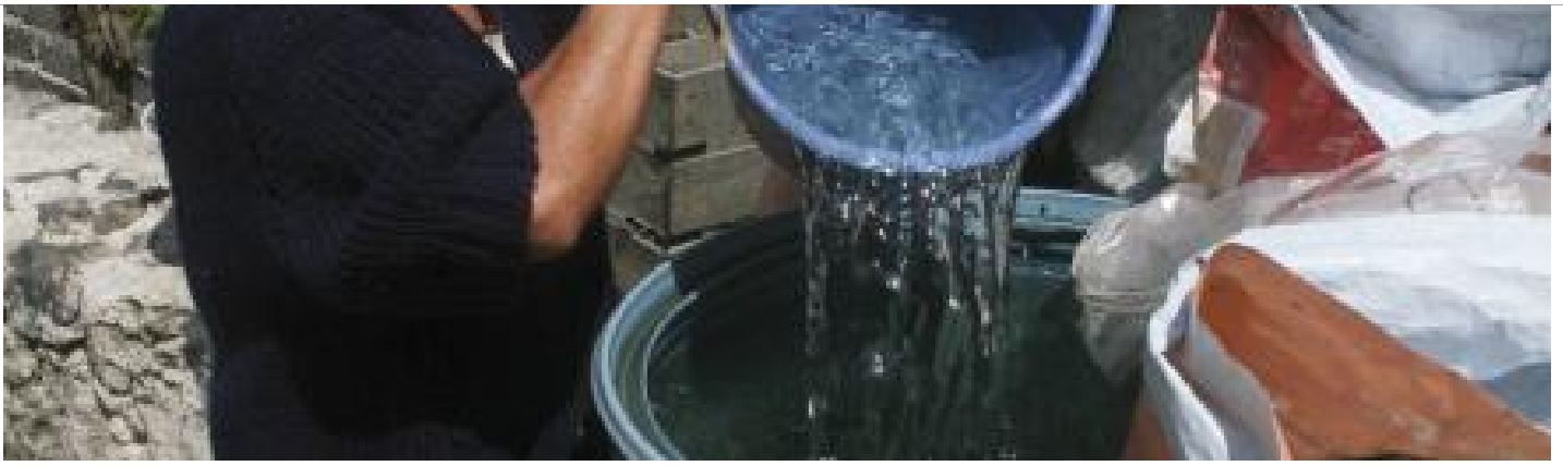
Un Acapulco sin agua en Iztapalapa